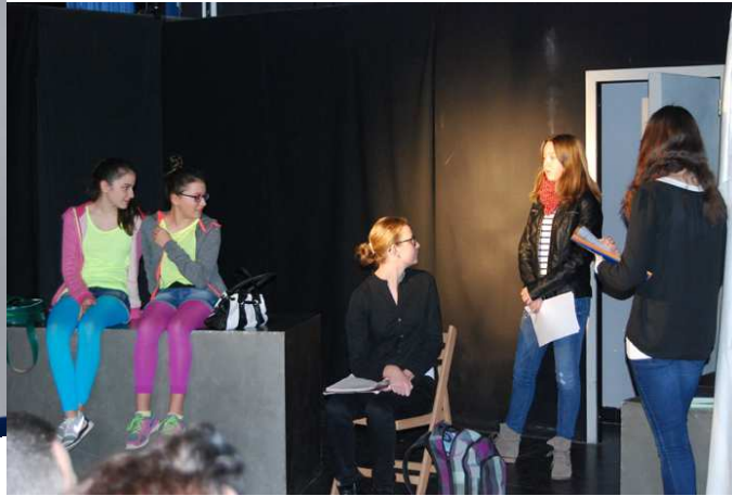
Das Jubiläumstück - die Aufführung der Theater AG