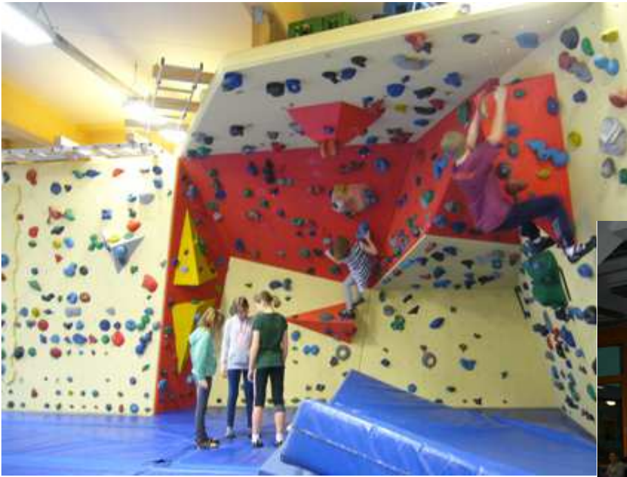
Klettern in der Boulderhalle: Sie konnte durch die Unterstützung des Fördervereins erst kürzlich erweitert werden.