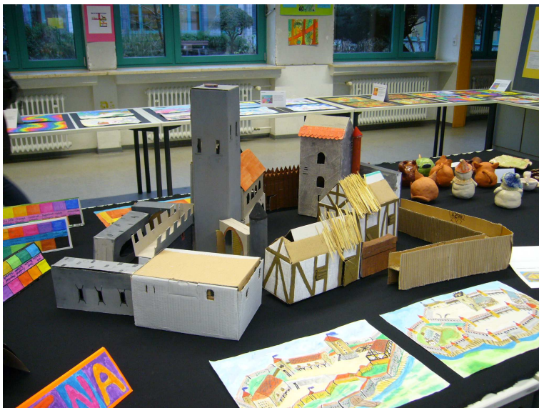
Die Kunstausstellung gab auch Einblick in das Projekt „Burg“ aus dem Wahlunterricht des Jahrgangs 8. Im Hintergrund Töpferarbeiten der gleichnamigen AG .