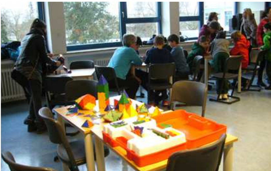
In der Mathematikwerkstatt gibt es Mathematik zum Anfassen.