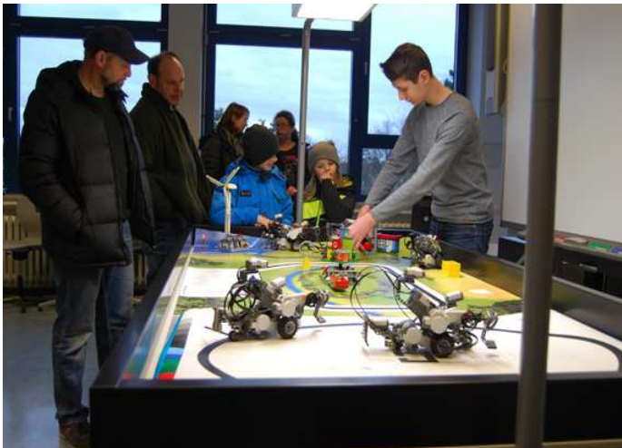
Fachbereich NaWi: Robotik und Experimente mit Feuer