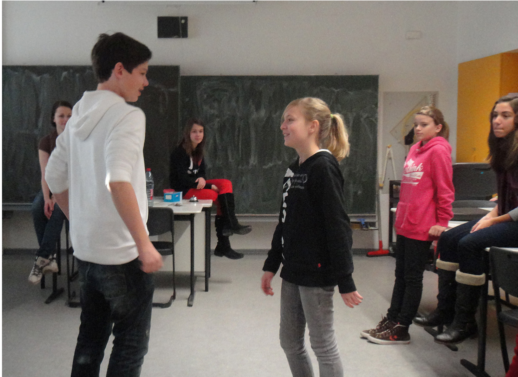
Die Sache mit den Klößen von Erich Kästner